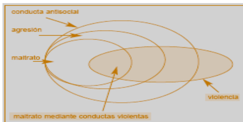
Figura 1 Delimitación del fenómeno del bullying